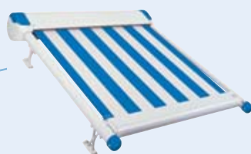
Flachanlage WGM 2030 Design

Alternativ können Sie eine WGM 2030 Design in Kombination mit der Fenster-Markise Aruba wählen. In diesem Fall werden Dachschräge und Seitenelemente unabhängig voneinander beschattet – natürlich ist beides mit der Fernbedienung zu steuern. Diese Lösung eignet sich besonders für kleinere Wintergärten.