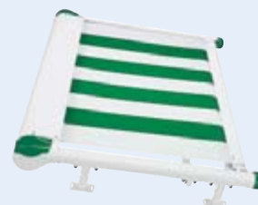
Flachanlage WGM 1030