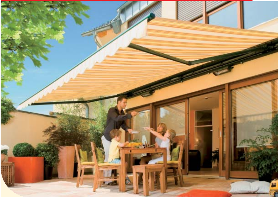
▲ weinor Markisen

▼ Die Glasoase® aus den weinor Terrassenwelten