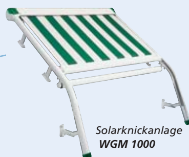
Solarknickanlage WGM 1000

Für größere Flächen können bis zu drei WGM 1000 und bis zu vier WGM 1030 nebeneinander montiert werden. Die Tücher fahren parallel ein und aus. Ab einer bestimmten Breite werden zwei durch einen Motor betriebene Einzelanlagen mit Hilfe eines Doppeltransportprofils verbunden.