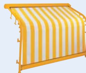
Bogenanlage WGM 2020 Design