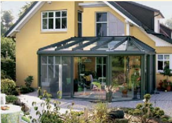
▲ weinor Wintergärten

Wie auch immer Sie Ihre Terrasse nutzen möchten, weinor hat das geeignete Produkt für Sie – Markise, Terrassendach, Glasoase® und Wintergarten